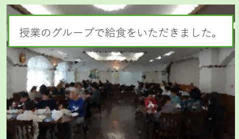
授業のグループで給食をいただきました。